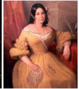
Izquierda: Escultura del artista camagüeyano Sergio Roque ubicada a inicios de la calle Avellaneda en honor a Gertrudis Gómez de Avellaneda / Arriba Derecha: Placa en fachada de la Casa Natal / Abajo Derecha: Retrato hecho por A. M. Esquivel.

y se conservan las cuatro columnas de fuste redondo sobre su pedestal coronadas con sencillo capitel. A la derecha del patio se alinearon los cinco enormes tinajones que antes estaban ubicados en distintos lugares del mismo, mientras que en el centro se colocó una fuente de estilo ecléctico. También se construyó un espacioso comedor en la galería del fondo del propio patio decorado con enchape de losa cerámica de gran belleza y techo de losa catalana.