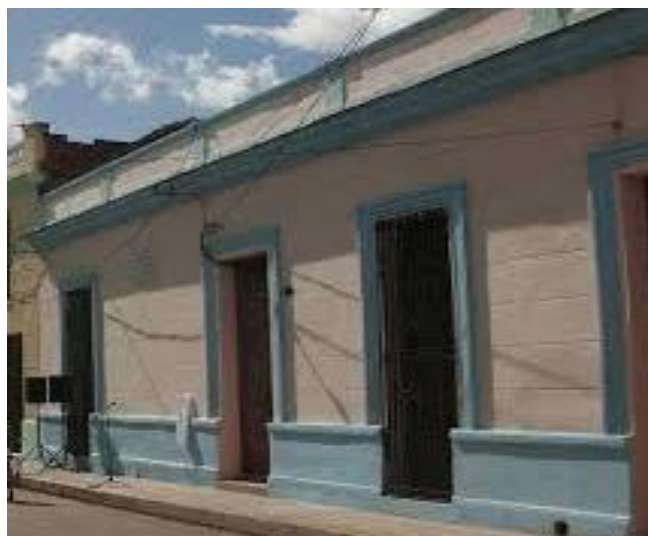
Casa Natal de Gertrudis Gómez de Avellaneda

A través de los años, la vetusta casona colonial donde naciera Gertrudis Gómez de Avellaneda perdió muchos elementos constructivos originales del período colonial, pues participó como testigo y reflejo del quehacer de los hombres en distintas épocas.