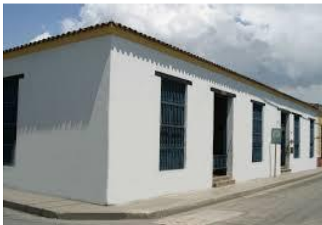
Casa Natal de Calixto García Iñiguez