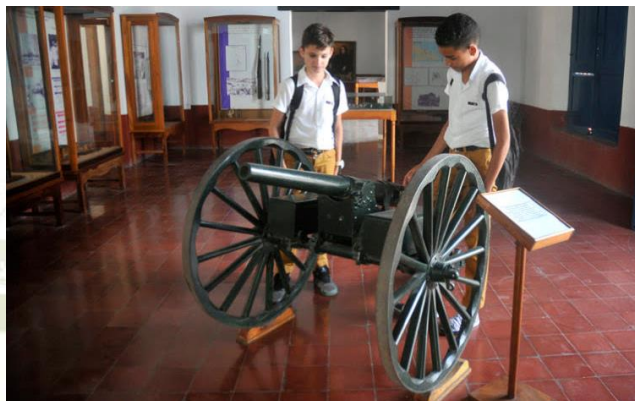
Casa Natal de Calixto García Iñiguez

Fuentes: Monumentos Nacionales de la República de Cuba, Colectivo de Autores, Collage Ediciones, 2015. http://www.ecured.cu/Casa_natal_de_Calixto_Garcia