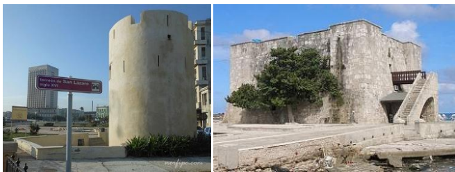
Izn.: Torreón de San Lázaro/ Dcr.: Torreón de La Chorrera