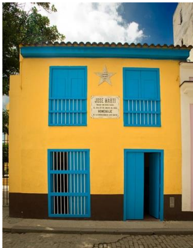
Casa Natal de José Martí en la calle Leonor Pérez (Paula), No. 314, entre Egido y Picota, La Habana Vieja.