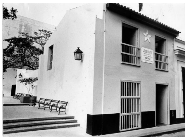
Arriba: Fidel en uno de sus recorridos por la Habana Vieja observa los trabajos de restauración (1962) / Abajo: Luego de ser restaurada por los especialistas de la Oficina del Historiador de la Ciudad.

Nota aclaratoria: El inmueble colindante con la casa tenía como uso un bodegón dedicado a la prostitución y el juego durante la República, en 1968 resulta demolido y convertido en un parque público, durante la restauración por parte de la Oficina del Historiador a partir del año 1994 se le coloca una verja perimetral.