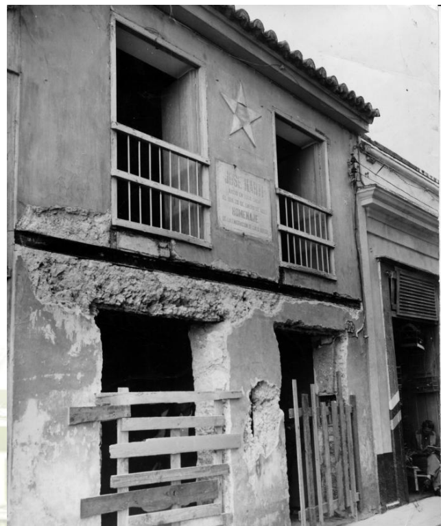
La casa fue declarada inhabitable el 12 de mayo de 1921