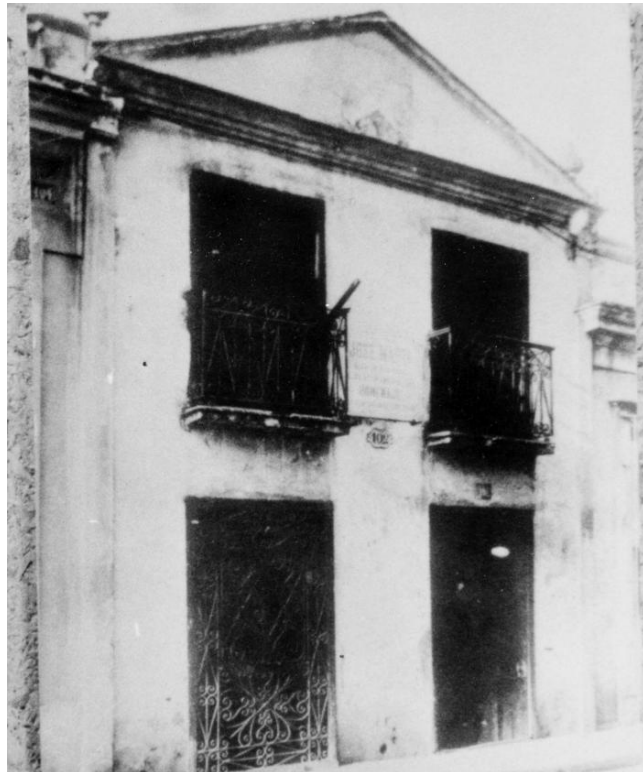
La casa entre 1900-1921 sufrió cambios en su fachada que posteriormente fueron retirados.

Aunque en 1953, el año del centenario de Martí, el museo fue sometido a una reparación total, la dedicación mayor fue tomada por los martianos de entonces que se organizaron en una comisión de apoyo y exigieron presupuesto al Gobierno para que estuviese en condiciones de exhibir sus colecciones y biblioteca que se estaban perdiendo en el olvido desde que se recogieron en 1949.