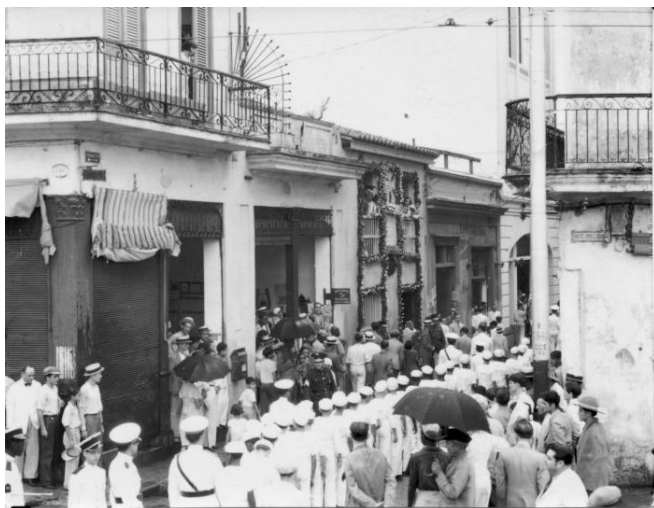
Acto celebrado en la Casa Natal el 19 de mayo de 1934